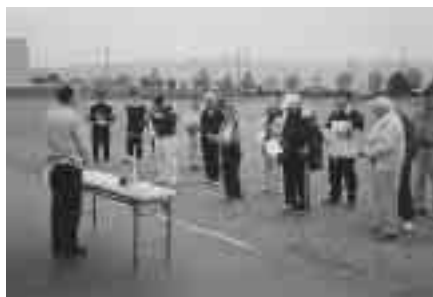
商業部会による親睦グランドゴルフ大会 (H 15.10.23 於角田市民グランド)

平成十五年四月一日から スタートした商工会の広域 連携は、四月一日に仙台市 内の三商工会(泉・宮城・ 秋保)がみやぎ仙台商工会 として、また加美郡四町の 商工会(中新田・小野田・ 宮崎・色麻)が十月一日に 加美商工会として合併。残 る六十一商工会は二十五エ リア体制で広域連携を実施 しており、その内十一エリ アでは経理処理の一本化が 実施されている。 本会は、角田・丸森広域 連携協議会を立ち上げ、広 域連携による事業体制を とっている。